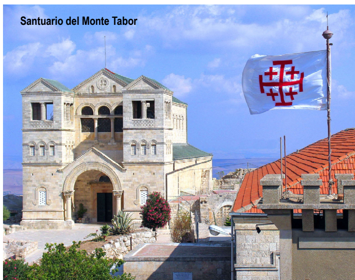
Santuario del Monte Tabor

26 Agosto: JERUSALÉN: Betania, Qumran, Mar Muerto, Jericó y Río Jordán Desayuno y traslado a Betania : pequeña aldea