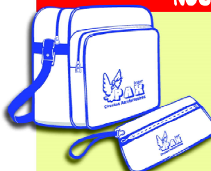
Bolsa y cartera documentación