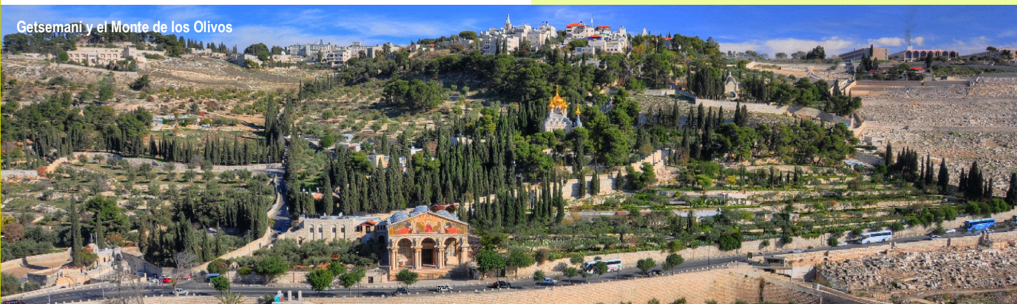
Getsemani y el Monte de los Olivos